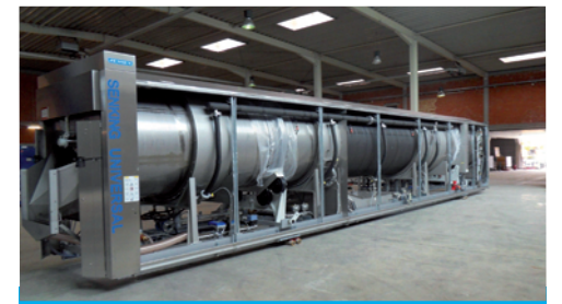
Das Herzstück der neuen Großwäscherei in NRW ist platziert.