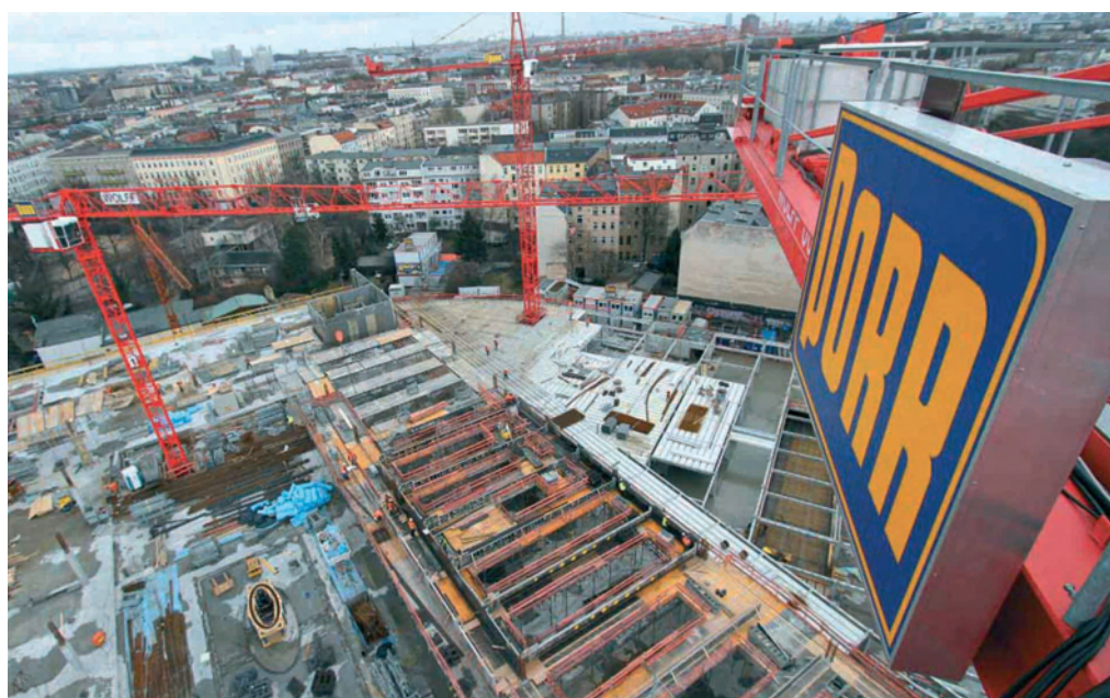
Die Porr Deutschland GmbH setzt bereits das sechste Projekt mit PlanTech Raummodulen um.