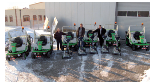
Schnell und leise, die sechs neuen Profi-Aufsitzmäher für Michaelis