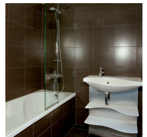
PlanTech-Bad im adagio München