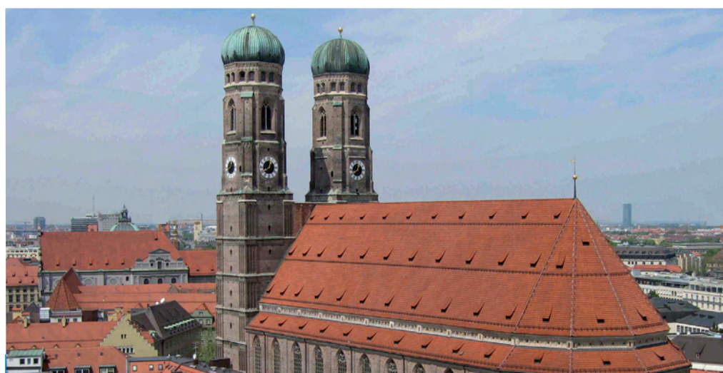
Nicht weit vom Apartmenthotel, die Frauenkirche in München

119 Badmodule im klassischen Design in drei Bädertypen