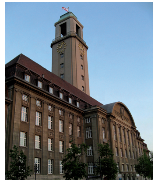
Das Rathaus Spandau, in dem sich heute das Bezirksamt Spandau befindet.