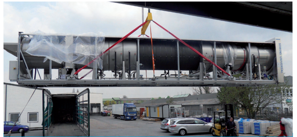
Die neue Takt-Waschanlage wird vom Sattelzug gehoben