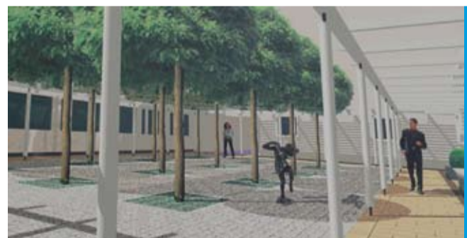
Der fertige Atrium-Innenhof im Modell.