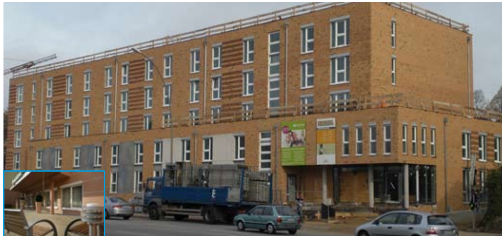
Im Projekt Hamburg-Ölmühlenweg kommen 155 barrierefreie Fertigbäder noch 2008 für die Casa-Reha zum Einsatz

Behrendt Bau aus Hamburg setzt auf Plantech