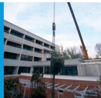
Der 5 Meter hohe Kugelahorn- Baum wird über das Dach in den Hof gesetzt.