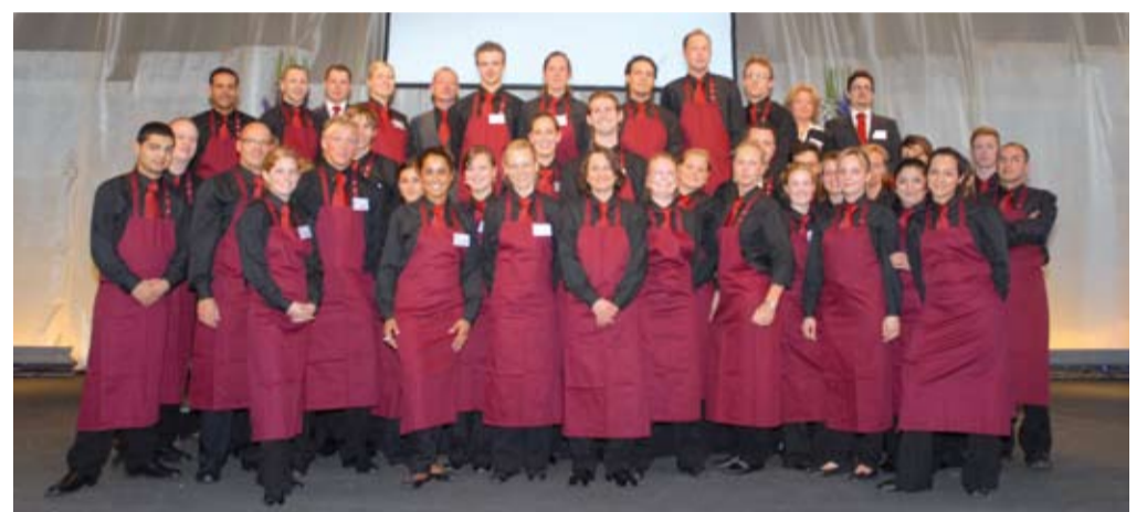
Das Schäfer Catering-Service-Team gut gelaunt vor dem Event. Die Gäste kamen mit einer historischen Dampflok vorgefahren.