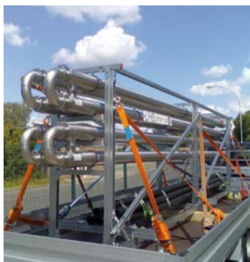
Sommer 2008: Lieferung des neuen Wärmetauschers nach Bad Freienwalde

Neuer umweltfreundlicher Wärmetauscher im Einsatz