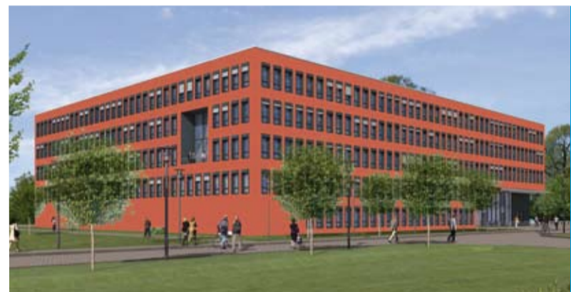
Das Branden- burgische Finanzmi- nisterium im Modell.

Im weiteren Sinn steht der Begriff Öffent- lich-Private Partnerschaft (ÖPP) für das kooperative Zusammenwirken von Hoheits- trägern mit privaten Unternehmen.